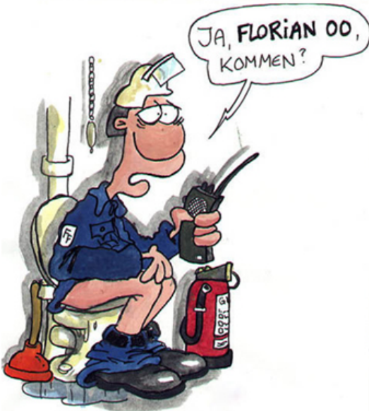
Bescherung bei der Feuerwehr...