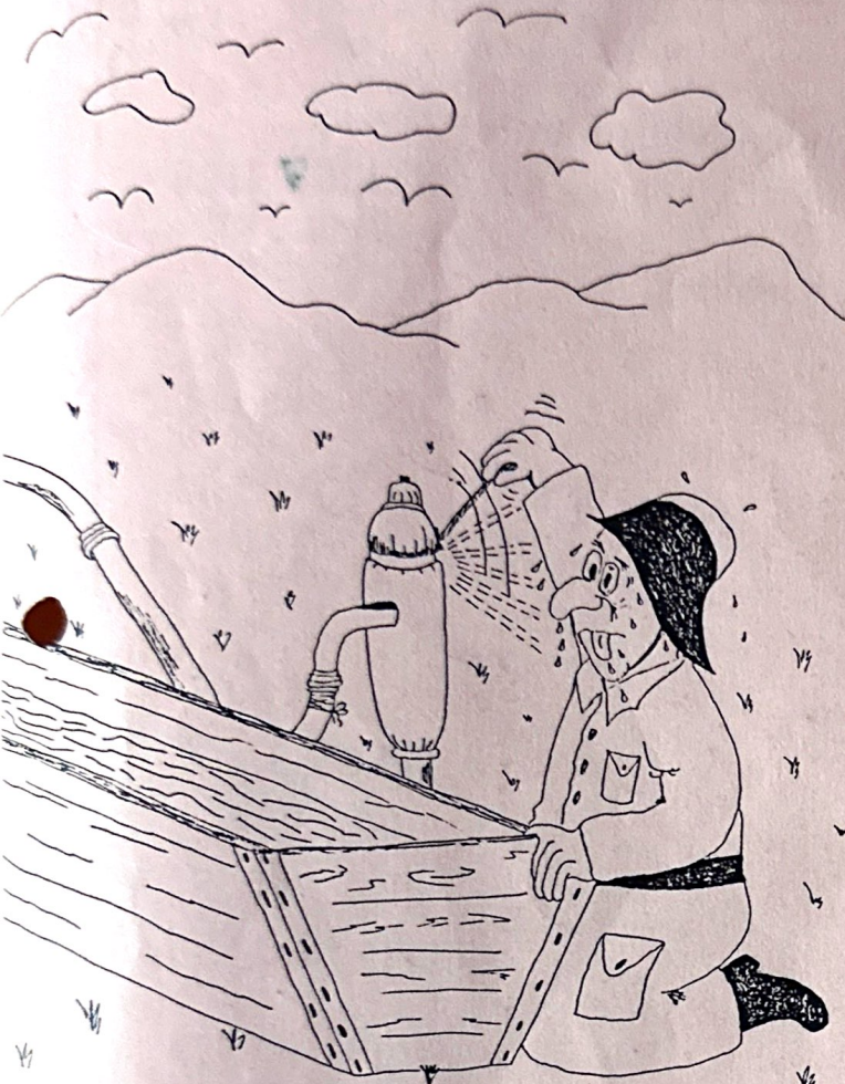
Wasser Marsch - Pump etwas schneller