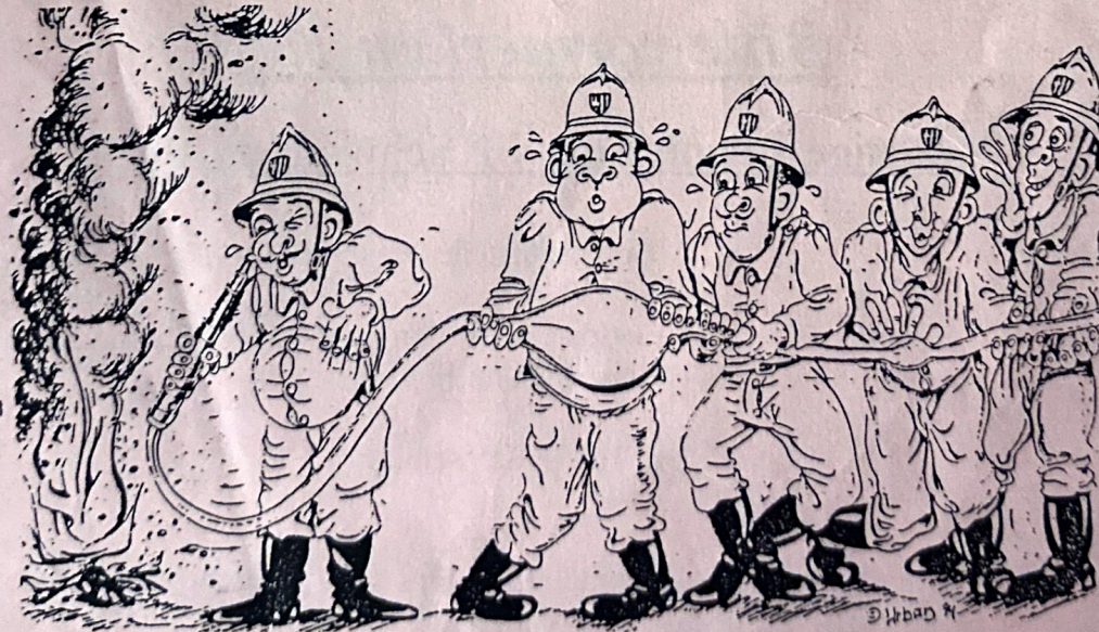
Wenn's auch manchmal etwas speißt und zwickt -- unsere Feuerwehrmänner finden immer einen Weg.